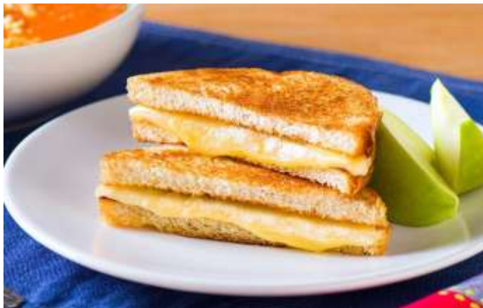
Sándwich de queso.