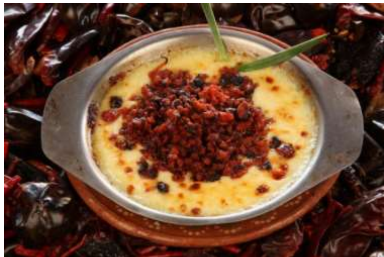
Chorizo con queso fundido